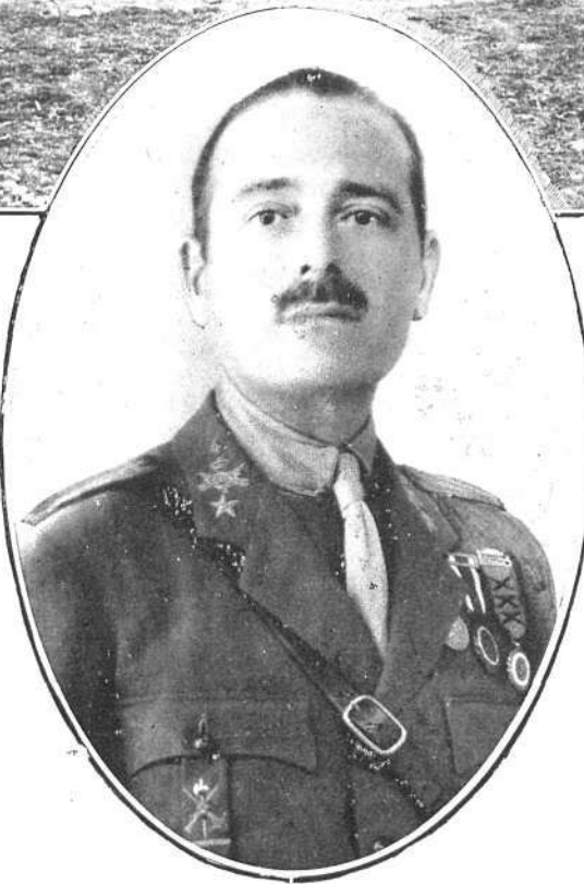
EL CORONEL MILLÁN ASTRAY Jefe del heroico Cuerpo de Legionarios españoles y extranjeros, que tan brillantes páginas ha escrito en la historia de la guerra en África

Una de esas interesantísimas pruebas de afecto cordialísimo se contiene en el telegrama que no podemos resistir la tentación de copiar y al que hemos contestado con otro que refleja pálidamente nuestra emoción y nuestra gratitud, que no puede expresarse con