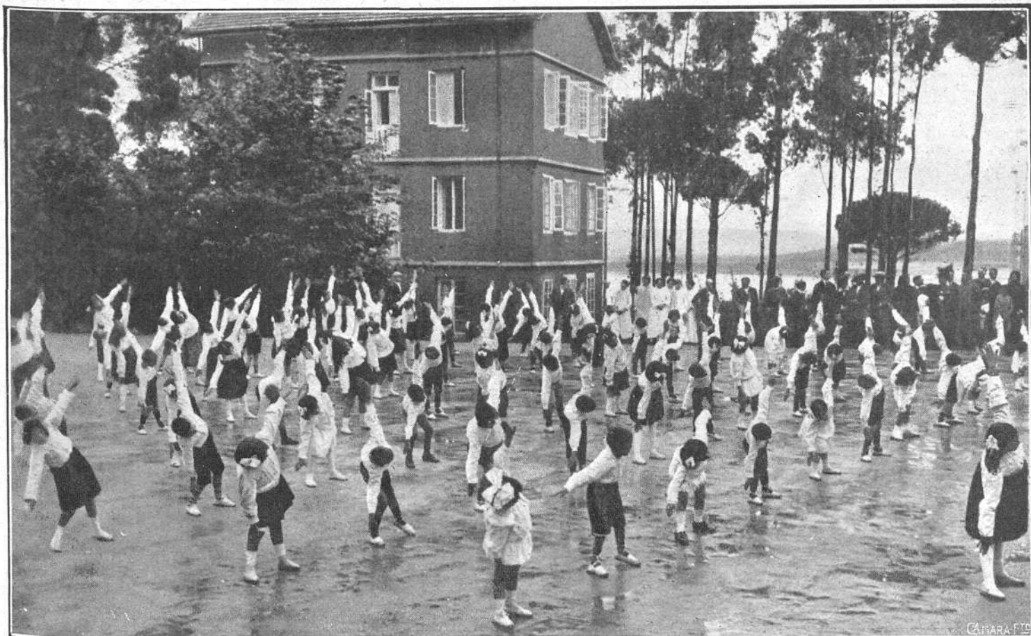
Los niños del Sanatorio de Pedrosa (Santander) haciendo ejercicios de gimnasia sueca ante SS. MM. los Reyes, durante la visita hecha por los soberanos á aquella benéfica institución

EL día 3 del actual se efectuó la visita de los Reyes al Sanatorio de Pedrosa, para inaugurar los nuevos pabellones que amplian el edificio, dotando á éste de mayores elementos, que han de traducirse