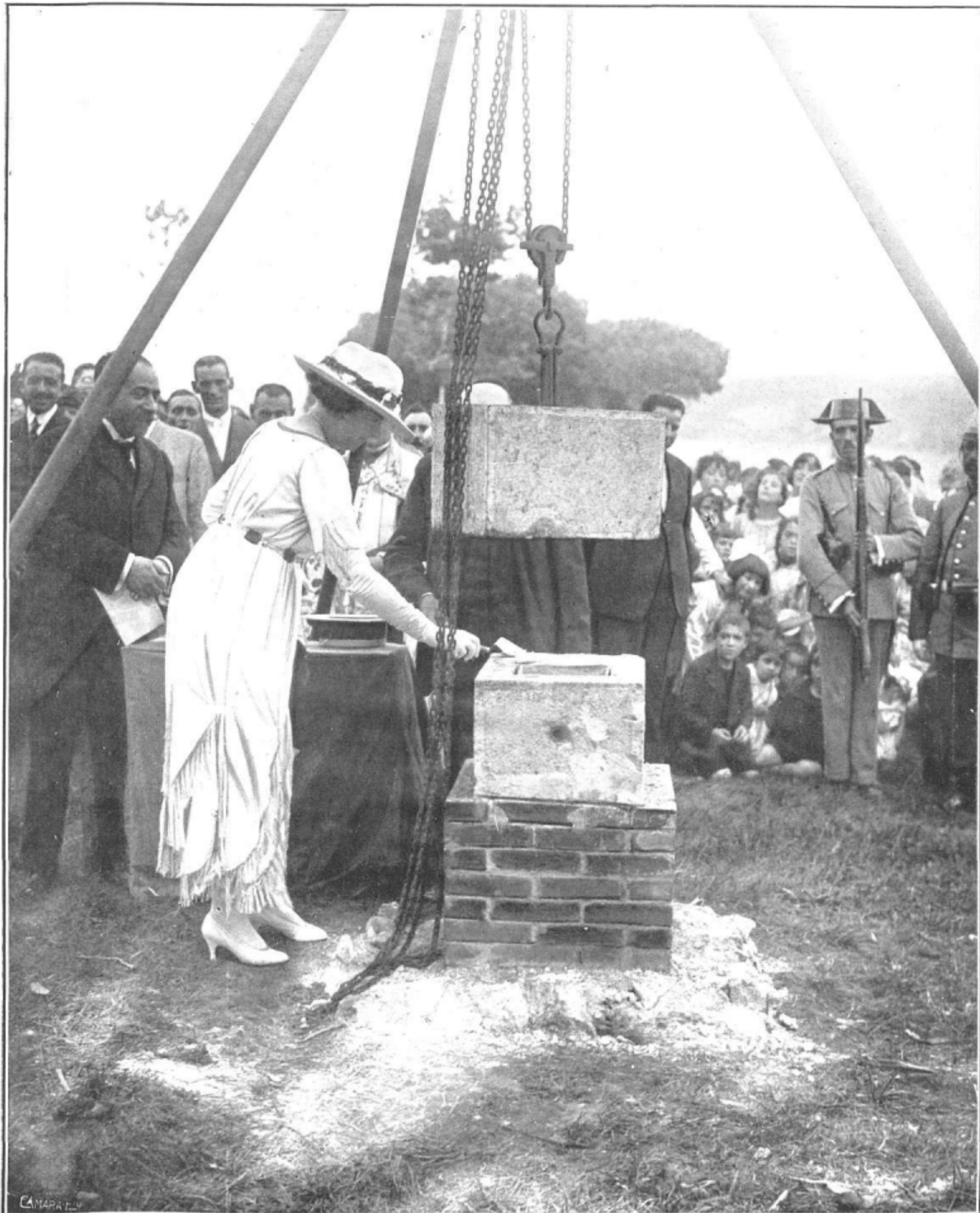
S. M. la Reina echando la primera paletada de tierra en el acto de la colocación de la primera piedra para el pabellón "Infanta Beatriz", que será construido en el Sanatorio de la Pedrosa (Santander).